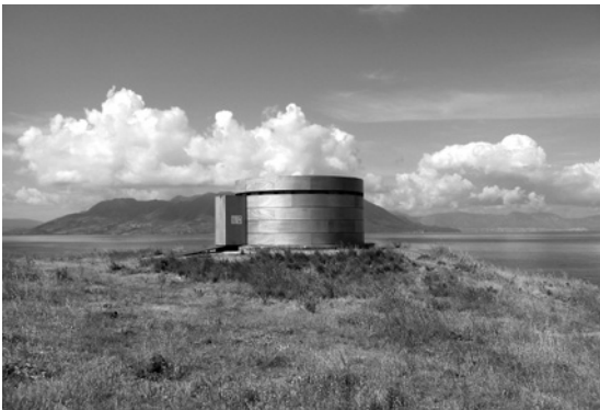
Abb. 7/8 Eine körperliche Erfahrung davon, was ein Medium ist, wie ein Bild entsteht: Camera Obscura, Gebäude Aegina, 2003 (beide Orig. in Farbe)

G.D. Erstens ist es eine rückbezügliche Behauptung: ›Film ist. Punkt‹ heißt: Er existiert. Und alles, was danach folgt, ist nichts anderes als eine von unendlichen Möglichkeiten. Darum steht am Ende bei jedem Film: wird fortgesetzt. Selbst wenn wir nicht mehr weiterarbeiten, weil es immer schwieriger wird, Zugriff auf die Materialien und die Projekte finanziert zu bekommen, selbst dann ist es open end .