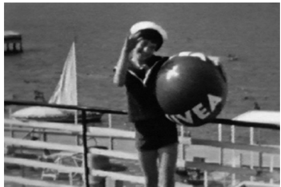
Abb. 3 (rechts) Im Eden des Kinsey-Archivs, Still aus Film ist. a girl & a gun , 2009