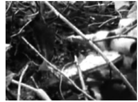
Abb. 1 Verzicht auf kausale Zusammenhänge – eine Schnittfolge von vier Sekunden aus The Empire Strikes Back: done in 60 seconds , 2009

Wenn die Sequenzen nicht nach ihrer narrativen Verkettung ausgewählt werden, dann stellt sich die Frage, welche Prinzipien bei deren Auswahl eine Rolle spielen. Darf man vermuten, dass die Schweder nur solche Sequenzen auswählen, die mit geringen Mitteln realisierbar sind? Wer dies glaubt, wird überrascht sein, dass gerade Filme, die für ihre Spezialeffekte bekannt sind, am häufigsten geschwedet werden. 13