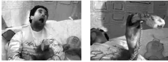
Abb. 3 Umdeutungen von Alltagsgegenständen – ein Telefonhörer als Alienbaby 17

Be Kind Rewind hatte genau dies vorgeführt: Bei der Schwedung von Boyz in the Hood wird einer Schaufensterpuppe, die auf dem Boden liegt, in den Kopf geschossen. Die Blutlache wird nun nicht mit Ketchup suggeriert, sondern durch eine Pizza Margherita, die man der Puppe unter den Kopf legt. In dieser unüblichen Funktion löst die Pizza Erstaunen aus und verblüfft gerade wegen der Zweckentfremdung durch ihre visuelle Effizienz. Was hier fasziniert, ist nicht die billige Pizza als alltäglicher Fastfood-Trash, sondern ihre metaphorische Dekontextualisierung mit ihrer Norm sprengenden und befreienden Wirkung. Die geschwedeten Filme lehren uns, dass der Alltag voller Überraschungen steckt, wenn man dessen utilitaristischen Rahmen aufbricht.