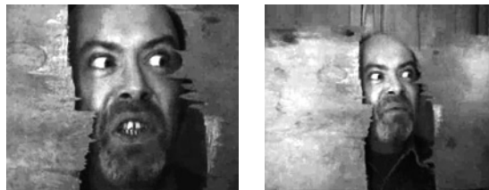
Abb. 2 Shining Sweded , 2008 Illusionsbruch als ästhetisches Prinzip

Gerade die improvisierten Requisiten verleihen dem geschwedeten Film den anderswo vermissten Hauch des Authentischen. Während die professionellen Produktionen nichts dem Zufall überlassen, kann die Indie-Ästhetik eben davon profitieren, dass sie die Kontingenz wieder spürbar macht und somit Vertrauen in die Bilder schafft und den Zuschauer aus seiner anstrengenden Rezeptionshaltung des Misstrauens erlöst. Ein deutliches Zeichen dafür, dass es um Vertrauen geht, ist die ständige Inszenierung des Illusionsbruchs im geschwedeten Film und zwar gerade dann, wenn Illusion möglich wird. In Shining Sweded 16 sieht der Darsteller dem Schauspieler Jack Nicholson mitunter zum Verwechseln ähnlich, und beim berühmten Blick durch die mit einer Axt gespaltene Badezimmertür kann man Original und Remake kaum noch unterscheiden. Und was tut das Indie-Remake daraufhin? Die Kamera fährt zurück und zeigt, wie der Darsteller zwei Holzstücke in die Luft hält, um die Illusion einer Tür zu schaffen (Abb. 2). Die Nachahmung will nicht täuschend echt sein, sie ist echt täuschend und legt ihr Spiel offen. Sie thematisiert sich als improvisierte Nachahmung und zieht damit bei aller spielerischen und ironischen Leichtigkeit eine selbstreflexive Ebene ein.