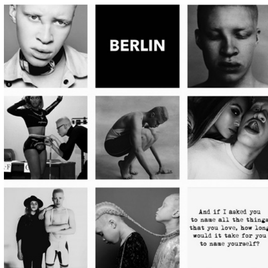
Abb. 3 Shaun Ross auf Instagram @shaundross (Screenshot, September 2016)

Ross' Abonnent_innen können ebenfalls zu denjenigen gerechnet werden, die er um sich schart, weil sie <wissen, wie großartig er wirklich ist>. «You are amazing» ist der häufigste Kommentar, nicht zuletzt auch deshalb, da Ross ihn seinen Abonnent_innen geradezu in den Mund legt, wenn er Bilder von sich postet: «This is me. I hope you like it, if not it's your loss ... I'm amazing» (7.9.2016). Teils hält er seine Fans auch explizit zum Feedback an, wenn